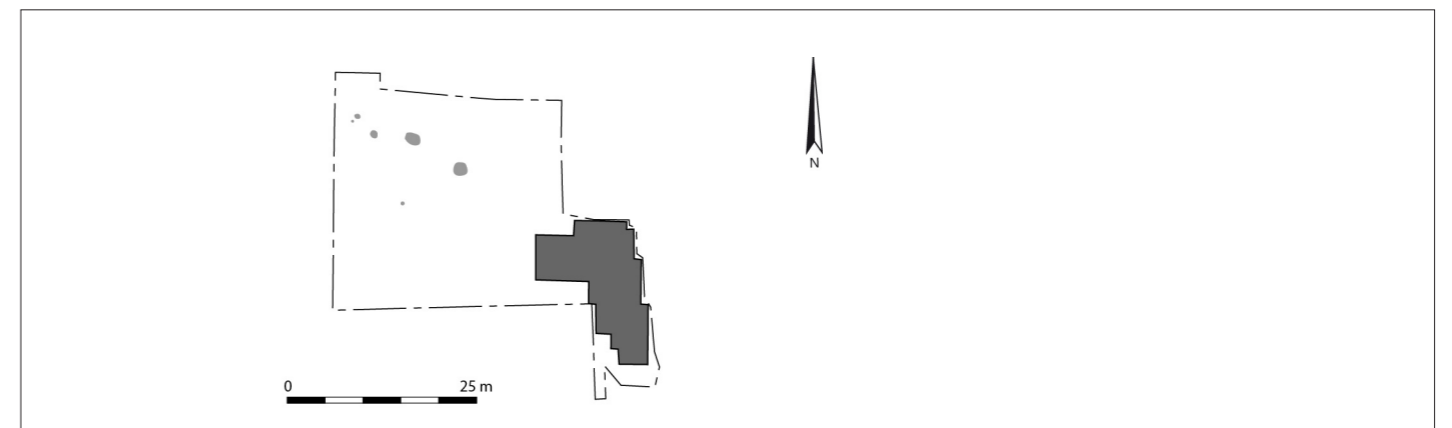
Figure 2 - Plan général du site de Champigneulles, les Pestiférés (Meurthe-et-Moselle) au 1/1000° (d'après Boura et al. , 1986b).